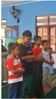
Gambar 4. Kegiatan Praktik Shalat

Peserta didik mendapatkan pembelajaran praktik wudhu dan shalat sesuai tuntunan Nabi Muhammad shalallahu alaihi wasalam. Materi mencakup rukun, syarat sah, hal-hal yang membatalkan, serta adab ibadah. Kegiatan ini meningkatkan keterlibatan peserta didik dalam shalat berjamaah di masjid.