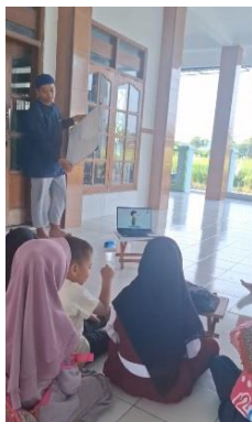
Gambar 5. Kegiatan Fun Learning

Peserta didik mendapatkan pembelajaran praktik wudhu dan shalat sesuai tuntunan Nabi Muhammad shalallahu alaihi wasalam. Materi mencakup rukun, syarat sah, hal-hal yang membatalkan, serta adab ibadah. Kegiatan ini meningkatkan keterlibatan peserta didik dalam shalat berjamaah di masjid.