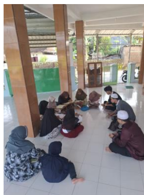
Gambar 3. Kegiatan Tahsin

Peserta didik dibimbing membaca dan menulis Al-Qur'an sesuai tingkat kemampuan masing-masing. Kegiatan meliputi pengenalan huruf hijaiyah, membaca secara bertahap, serta latihan menulis huruf Arab menggunakan metode yang sistematis.