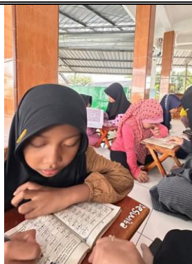
Gambar 2. Kegiatan Pendampingan BTA

Hasil wawancara dengan pengajar menunjukkan perlunya inovasi metode belajar yang lebih sesuai dengan karakteristik peserta didik usia anak-anak. Oleh karena itu, tim pengabdian menerapkan pendekatan fun learning sebagai alternatif metode yang lebih menarik dan aplikatif.